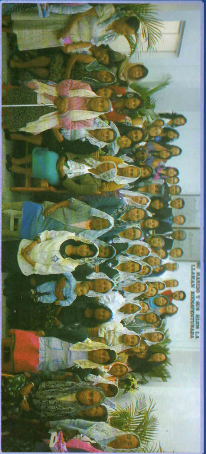
Reunión Regional Femenil en Pachuca Hidalgo